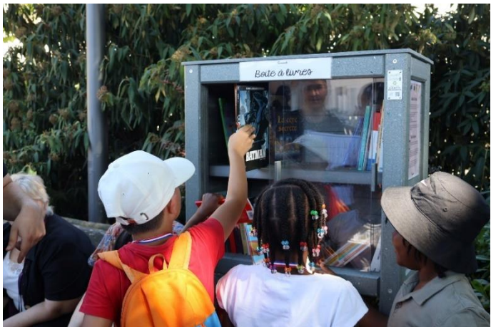
Installation de boîtes à livres ou d'équipements