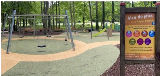
Concertation sur la nouvelle aire de jeux du parc (05/06)