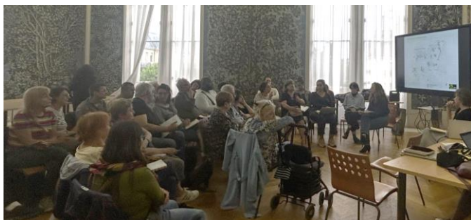
Réunion avec les habitants et les collectifs de défense de l'Îlot 8 au centre-ville de Saint-Denis (03/06)