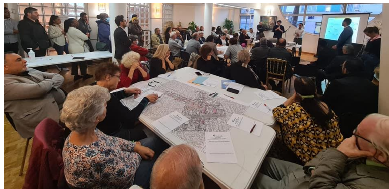
Temps de concertation sur les projets urbains impactant le quartier