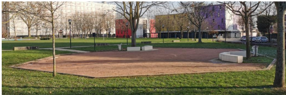
Impulsion de petits projets urbains