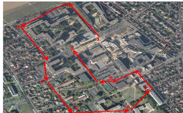
Organisation de diagnostics en marchant pour corriger les dysfonctionnement